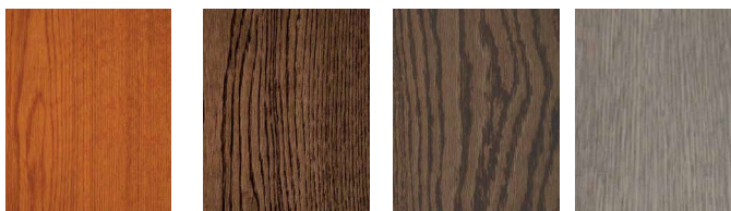
AUTUNNO NOCE OLD FUME TORTORA