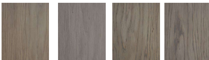
CELESTE FRESCO NEVE SABBIA

Pokazane próbki zostały wykonane na dębie i mają charakter poglądowy. Zalecamy próbę praktyczną na konkretnym materiale w pełnym systemie.