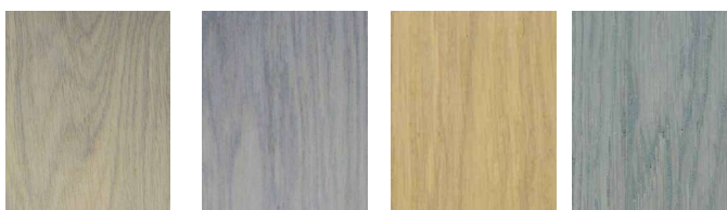
TITANIUM GRY STONA VANILLA HAVANA