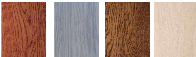
CILIEGLIO GRIGIO NOCE CLASSIC BLANCO